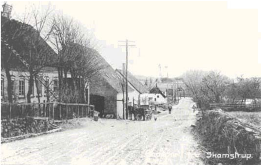
Billede af Skamstrup 1913

Nyhedsbrev for Foreningen Skamstrup og Omegn