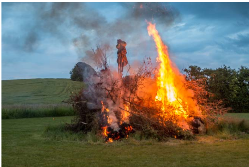
Sct. Hans 1915

Når bålet er ved at være brændt ud, går vi tilbage til forsamlingshuset og fortsætter det hyggelige samvær.