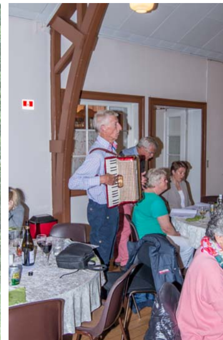
Båltaler 2015; Arthur – Underholdning Walter