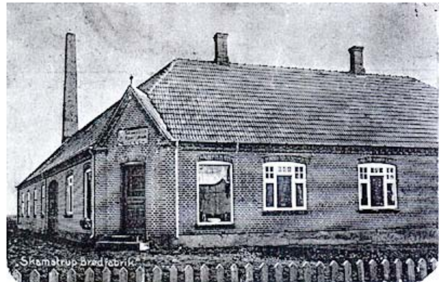
Billede af brødfabrikken 1938